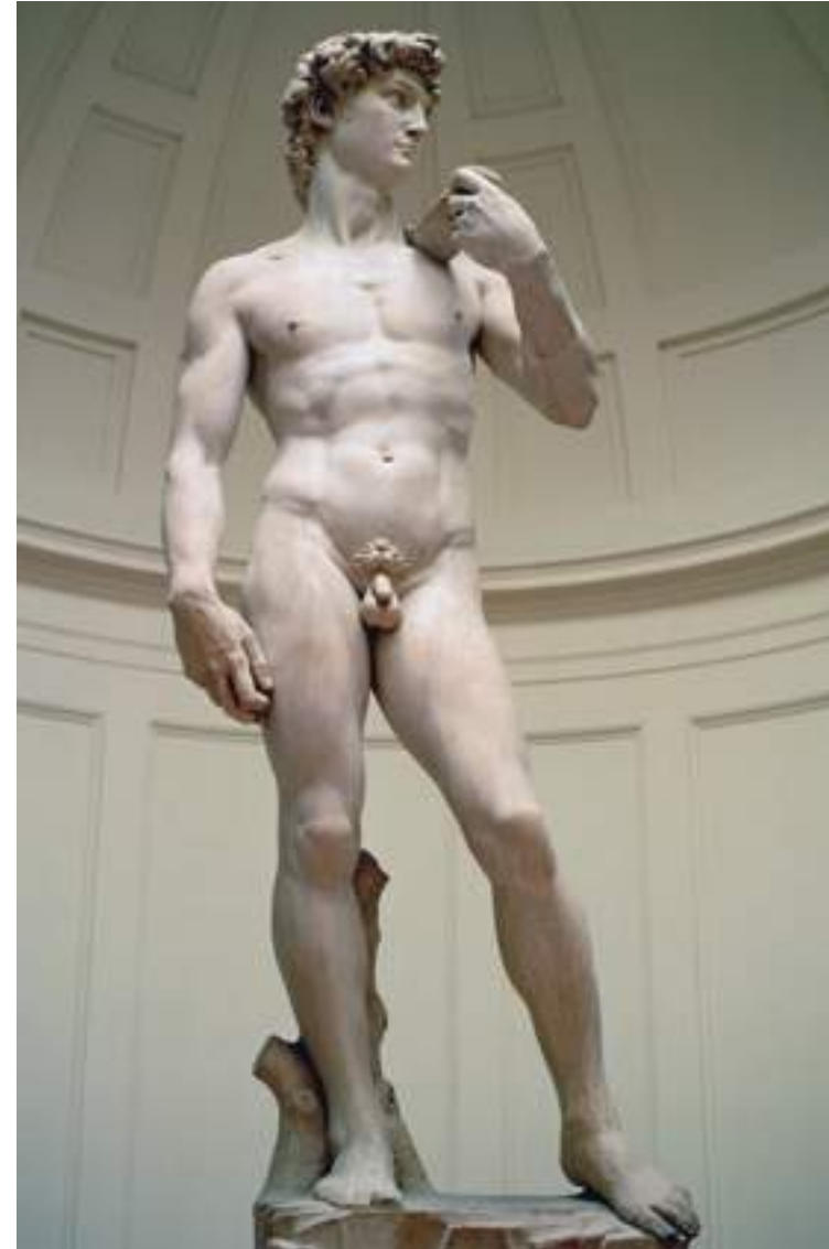
© Michel-Ange, David, 1501-04 Galleria dell'Accademia, Florence

Net zoals elke andere artistieke beweging maakt het hyperrealisme, en in dit geval de hyperrealistische beeldhouwkunst, deel uit van de lange traditie van de westerse kunst, waarvan elke fase een moment in de beschaving illustreert. Nu al kondigen zich de nieuwe vormen aan die kunnen ontstaan doordat de digitale revolutie ook ingang vindt in de kunst. Hoe zal de beeldhouwkunst er morgen uitzien, en hoe ziet ze er nu al uit?