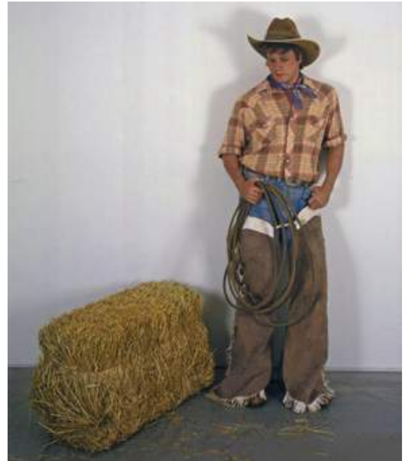
Duane Hanson, Cowboy with hay, 1984/1989 Courtesy of Jude Hess Fine Arts and Institute for Cultural Exchange, Tübingen

Zoals elke grote kunstvorm houdt het hyperrealisme ons een spiegel voor die onze woelige tijd reflecteert. Dat gebeurt op een onverwachte, aangrijpende, soms beangstigende, maar vaak gewoon heel leuke manier. Boeiend is het.