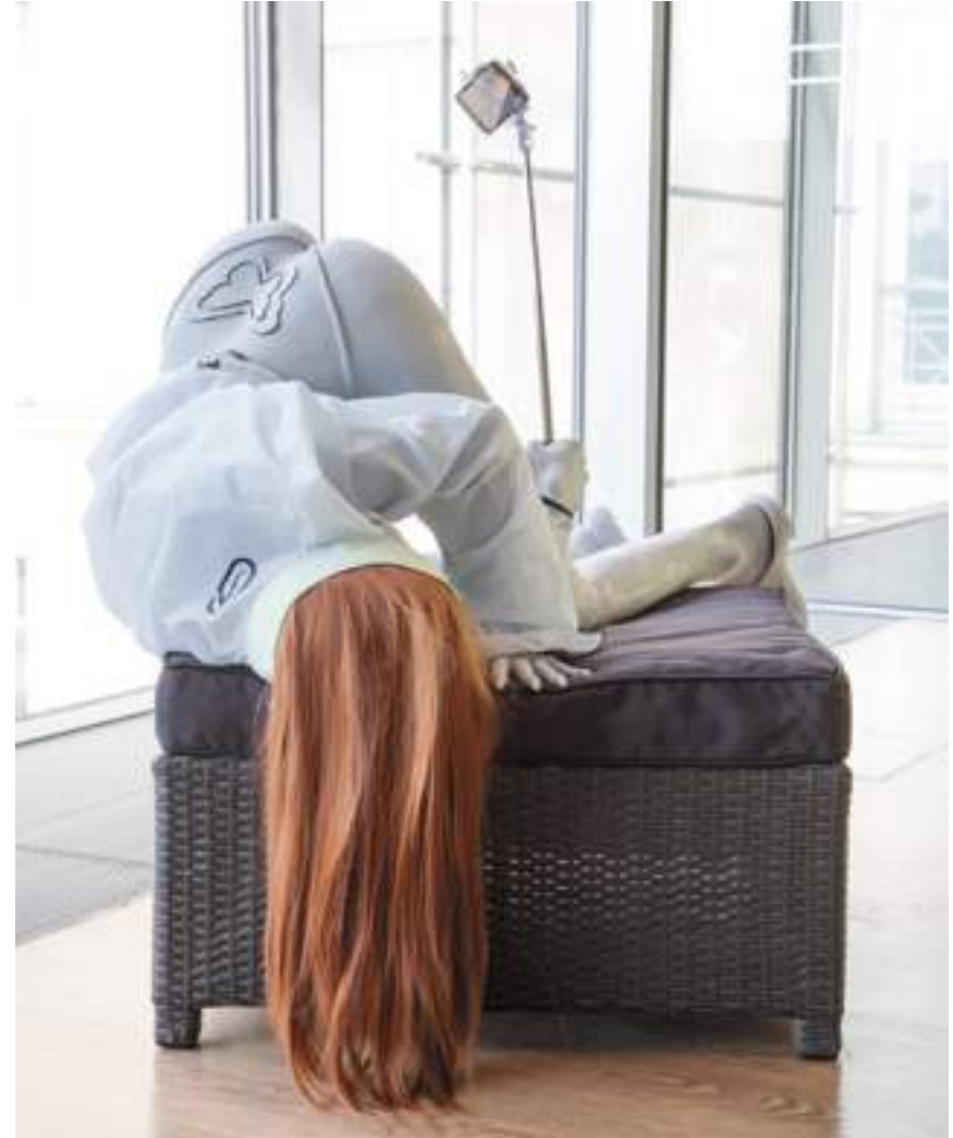
Anna Uddenberg, Journey of Self Discovery , 2016 ©9th Berlin Biennale for Contemporary Art, installation view Courtesy of the artist and Kraupa-Tuskany Zeidler, Berlin Photo: Timo Ohler

Terwijl de hyperrealistische beeldhouwkunst in oorsprong voortvloeit uit een eenvoudig idee - het overzetten in drie dimensies van het niveau van perfectie dat de fotorealistische schilderkunst heeft bereikt - moet het zich vandaag aanpassen aan de nieuwe media en de technologische vooruitgang. En dat zal in de toekomst ongetwijfeld nog veel meer het geval zijn. Het gebruik en de invloed van digitale tools zoals het internet, de smartphone en tablets worden zelf het onderwerp van de werken. Het belangrijkste thema dat door talrijke kunstenaars - Anna Uddenberg, Glaser/Kunz ... - in beeld wordt gebracht, is ons dagelijkse leven, een leven dat bepaald wordt door de digitale bubbel en zijn eindeloze, zich herhalende communicatiestroom.