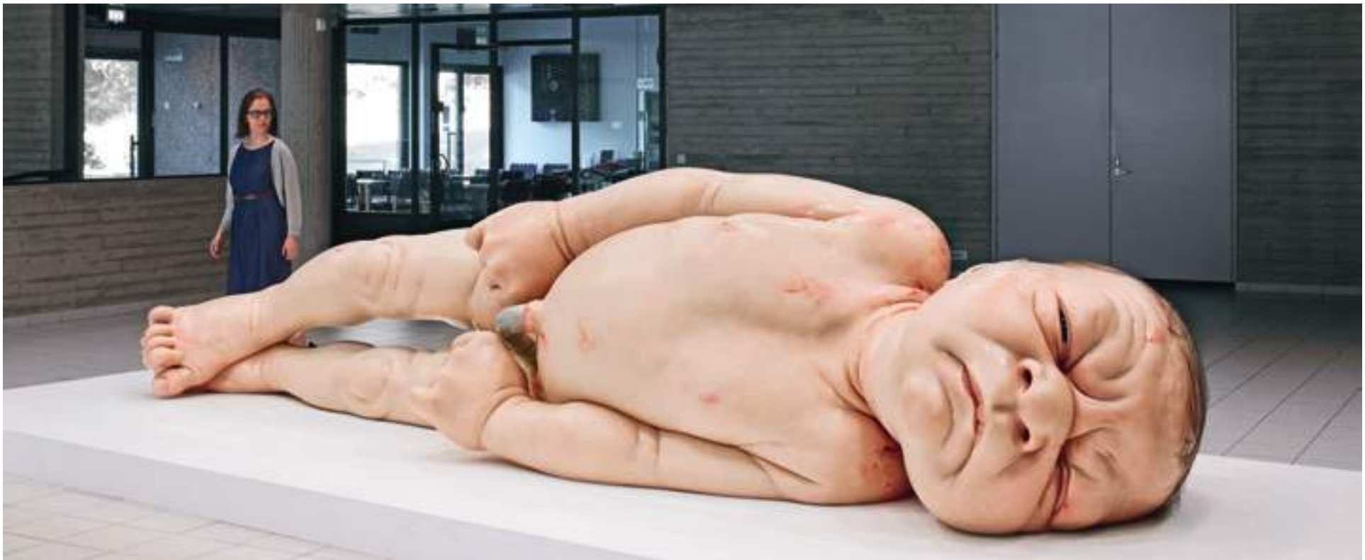
Ron Mueck, A Girl, 2006 ©Ron Mueck Scottish National Gallery of Modern Art. Purchased with the assistance of the Art Fund 2007