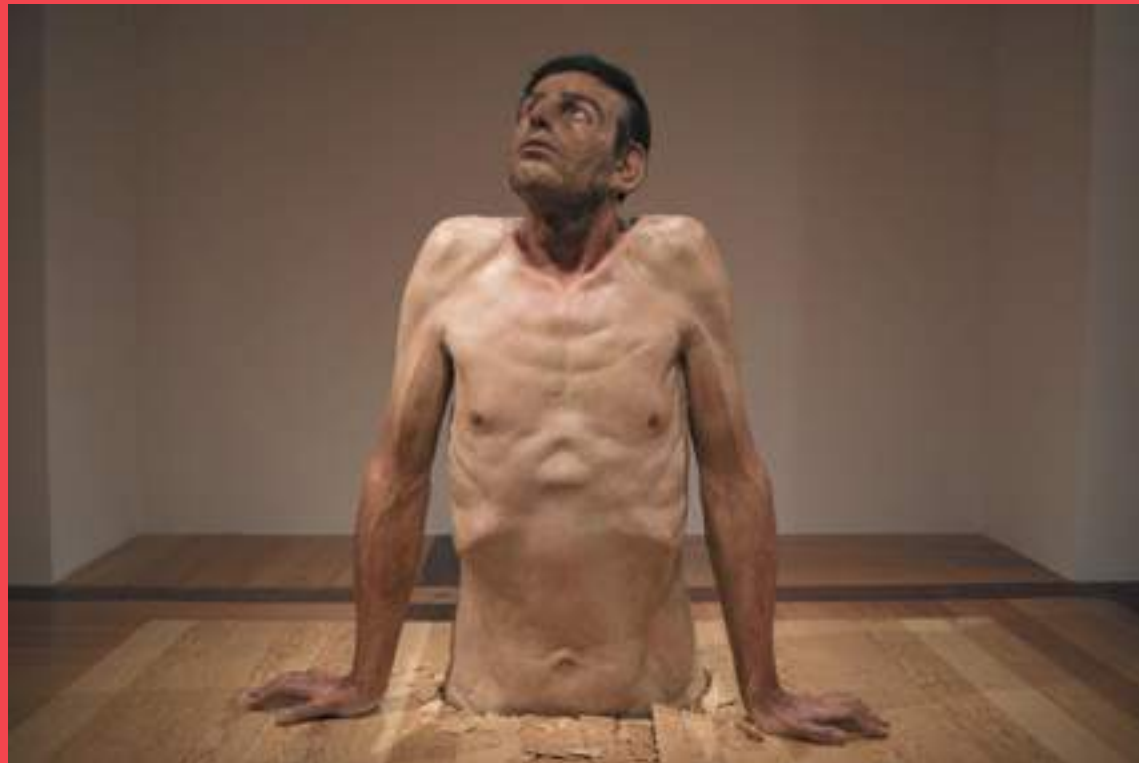
Zharko Basheski, Ordinary Man, 2009-10 ©Zharko Basheski Courtesy of the artist and Institute for Cultural Exchange, Tübingen