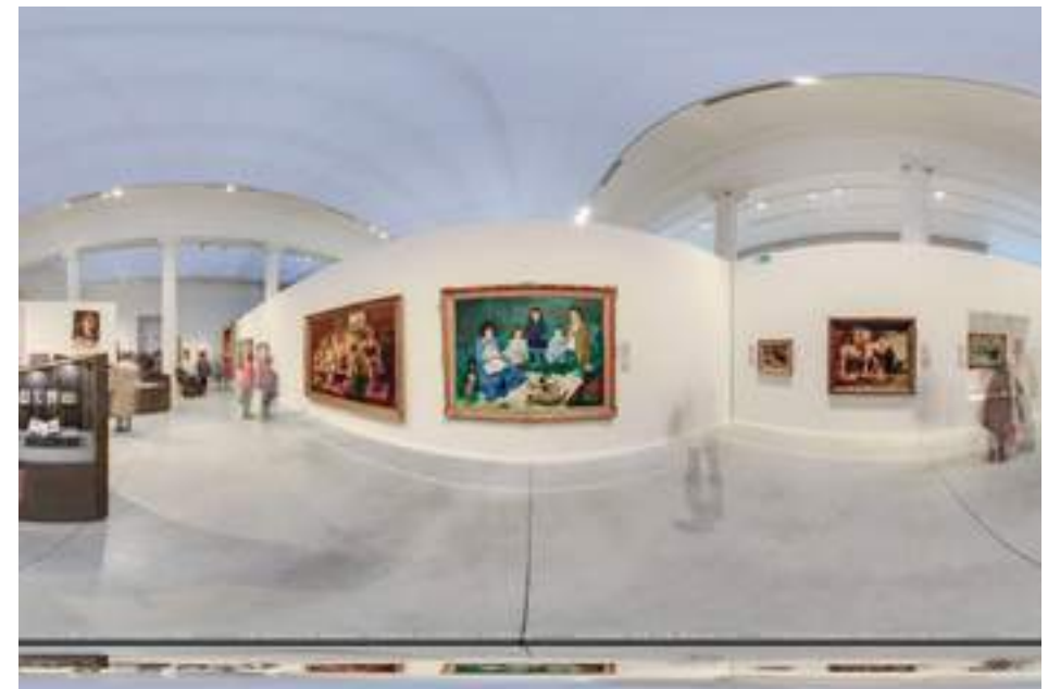
21 rue la Boétie, 2016-2017 La Boverie