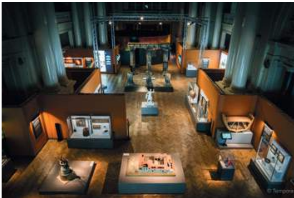
Pompeii, the immortal city, 2017-2018 Bourse de Bruxelles

Eén van de eigenschappen van Tempora is haar internationale ervaring in Europa, Azië en Noord-Amerika, door tentoonstellingen te realiseren die voorbestemd zijn om rond te reizen en door het uitwerken en realiseren van permanente tentoonstellingen voor derden in het buitenland.