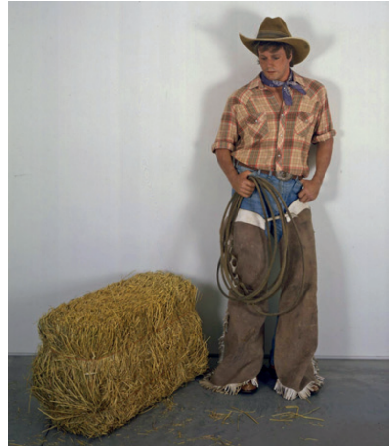
Duane Hanson, Cowboy with hay, 1984/1989 ©Estate of Duane Hanson / VG Bild-Kunst, Bonn 2019 Courtesy of Jude Hess Fine Arts and Institute for Cultural Exchange, Tübingen

Zoals elke grote kunstvorm houdt het hyperrealisme ons een spiegel voor die onze woelige tijd reflecteert. Dat gebeurt op een onverwachte, aangrijpende, soms beangstigende, maar vaak gewoon heel leuke manier. Boeiend is het.