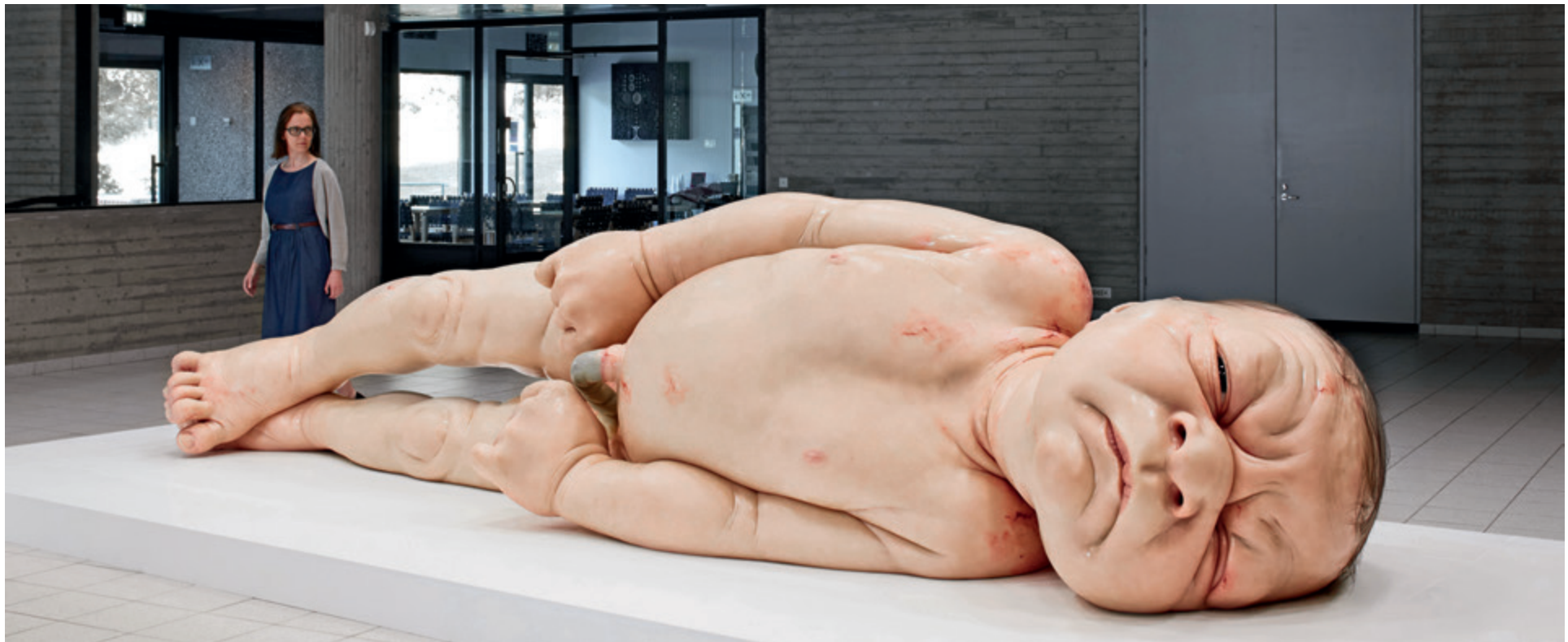
Ron Mueck, A Girl, 2006