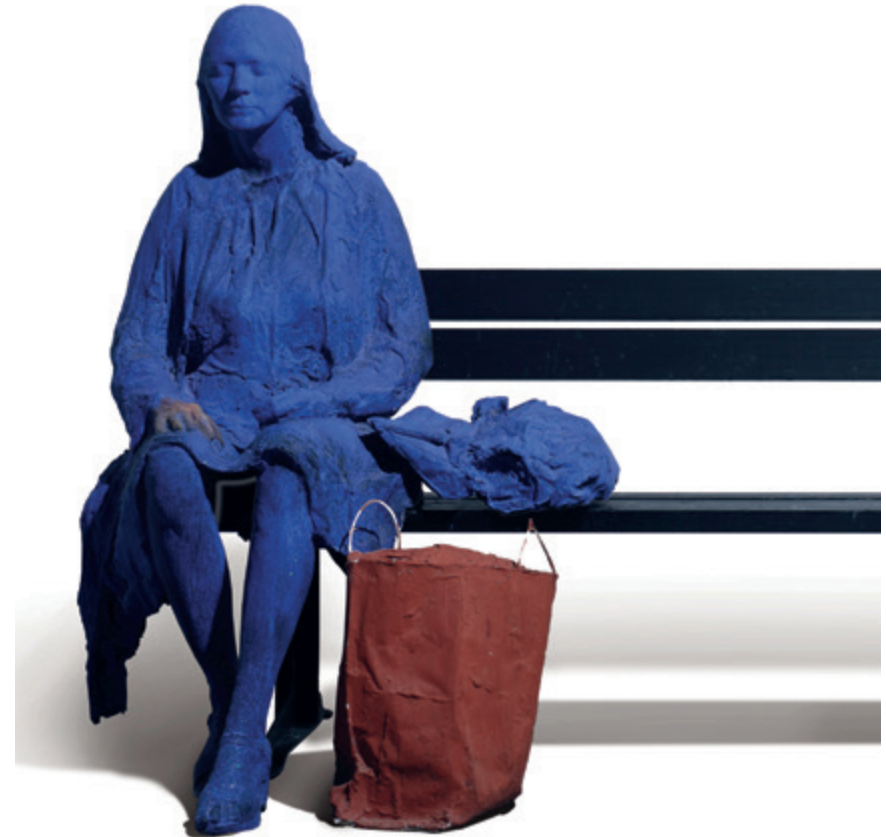
George Segal, Blue Girl on Park Bench, 1980