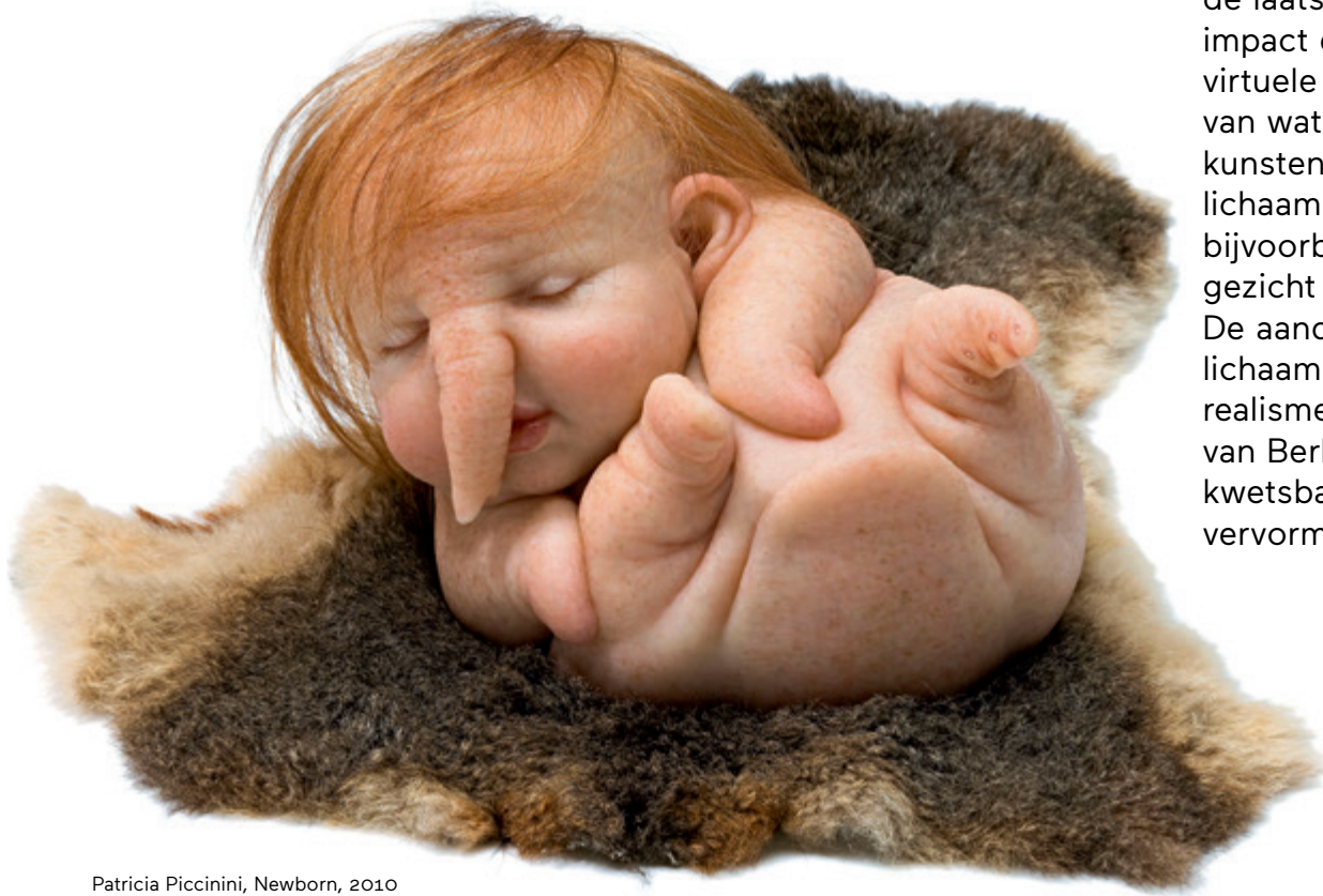
Patricia Piccinini, Newborn , 2010 ©Patricia Piccinini Courtesy of the artist, Roslyn Oxley9 Gallery, Sydney and Institute for Cultural Exchange, Tübingen

De innovaties in de wetenschap en de digitale media hebben in het bijzonder geleid tot een radicale verandering van het begrip van de werkelijkheid. Tijdens de laatste decennia kon de mensheid de krachtige impact ervaren van de genetische manipulatie en de virtuele realiteit. Deze invloeden veranderden ons idee van wat het betekent om een mens te zijn. Terwijl kunstenaars in navolging van Evan Penny het menselijk lichaam in vervormde perspectieven tonen, wijzigt bijvoorbeeld Patricia Piccinini datgene wat op het eerste gezicht menselijk is, in humanoïde of hybride schepsels. De aandacht voor de vluchtige aard van het menselijk lichaam beïnvloedde ook het hedendaagse figuratieve realisme. De lichamelijke aanwezigheid van de beelden van Berlinde De Bruyckere toont de menselijke kwetsbaarheid in haar voorstelling van lichamen die vervormd zijn door pijn en het lijden.