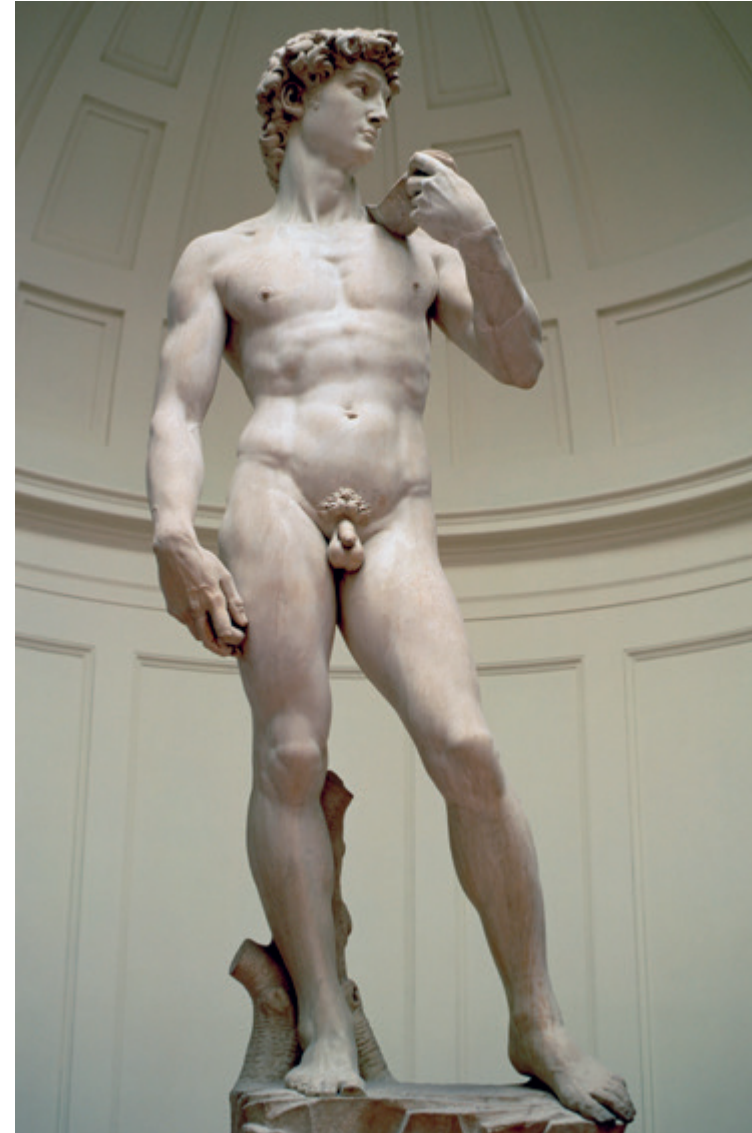
© Michel-Ange, David, 1501-04 Galleria dell'Accademia, Florence

Net zoals elke andere artistieke beweging maakt het hyperrealisme, en in dit geval de hyperrealistische beeldhouwkunst, deel uit van de lange traditie van de westerse kunst, waarvan elke fase een moment in de beschaving illustreert. Nu al kondigen zich de nieuwe vormen aan die kunnen ontstaan doordat de digitale revolutie ook ingang vindt in de kunst. Hoe zal de beeldhouwkunst er morgen uitzien, en hoe ziet ze er nu al uit?