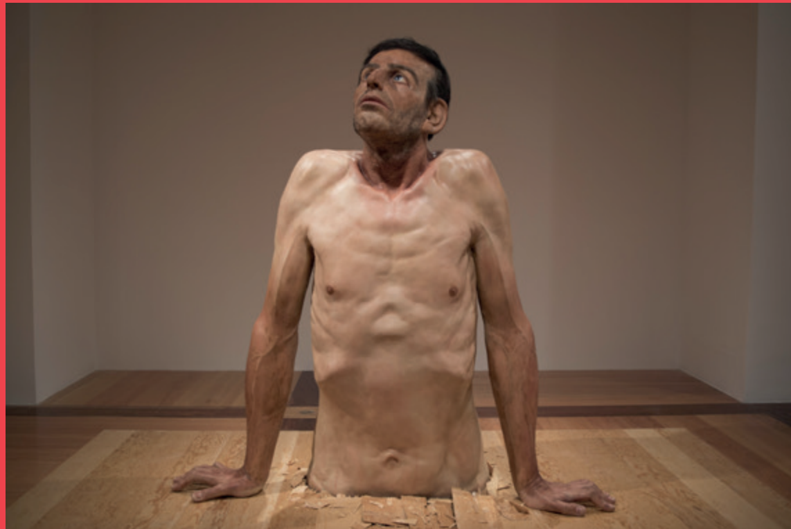
Zharko Basheski, Ordinary Man, 2009-10 ©Zharko Basheski Courtesy of the artist and Institute for Cultural Exchange, Tübingen