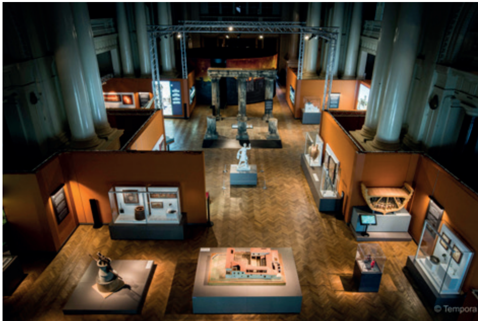
Pompeii, the immortal city, 2017-2018 Bourse de Bruxelles

Eén van de eigenschappen van Tempora is haar internationale ervaring in Europa, Azië en Noord-Amerika, door tentoonstellingen te realiseren die voorbestemd zijn om rond te reizen en door het uitwerken en realiseren van permanente tentoonstellingen voor derden in het buitenland.