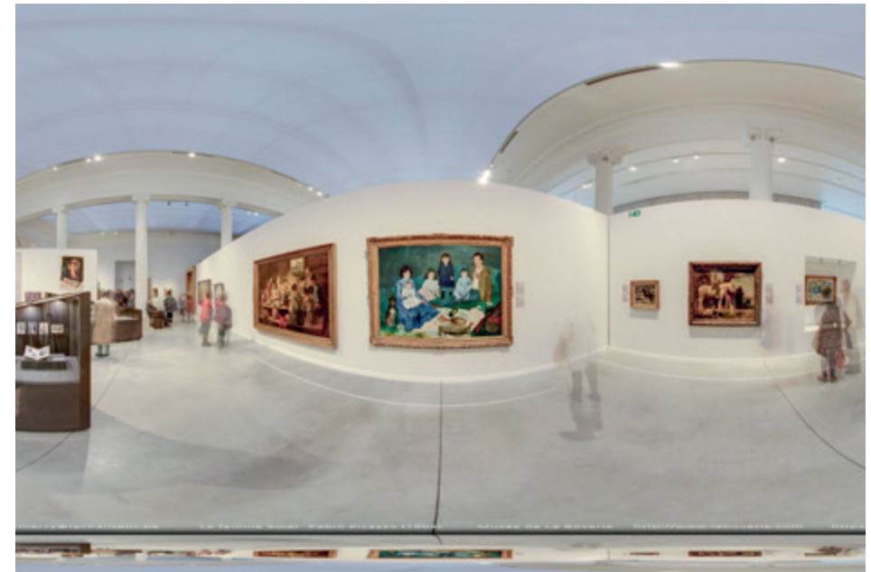
21 rue la Boétie, 2016-2017 La Boverie