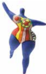
Nana van Niki de Saint Phalle, 20 e eeuw