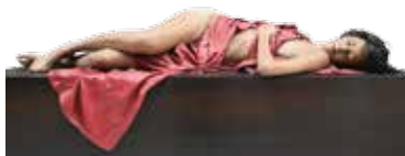
Girl with the red drape, 1984