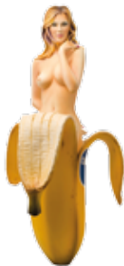
Chiquita Banana, Mel Ramos