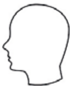
Enkel een hoofd