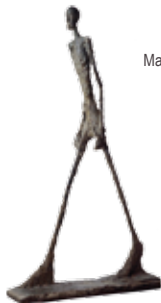
Lopende man, A. Giacometti, 20 e eeuw