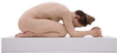
Sam Jinks, Untitled (Kneeling Woman)