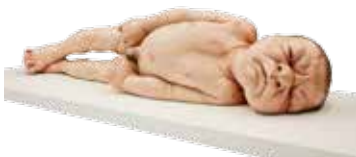
Ron Mueck, A Girl