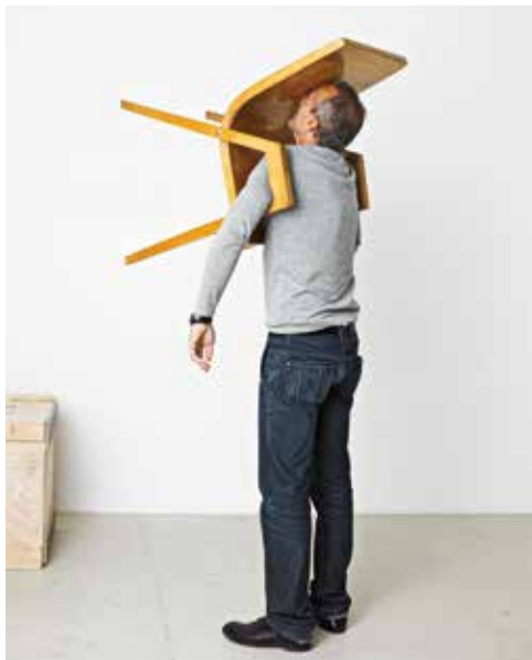
Erwin Wurm, Idiot II, 2003, Performed by the artist

Quoi de plus réaliste qu'une sculpture en chair et en os ? L'idée de l'artiste Erwin Wurm est de nous faire devenir nous-même une sculpture hyperréaliste !