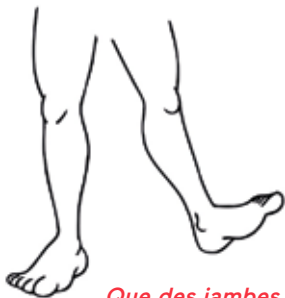
Que des jambes