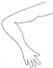
Que des bras